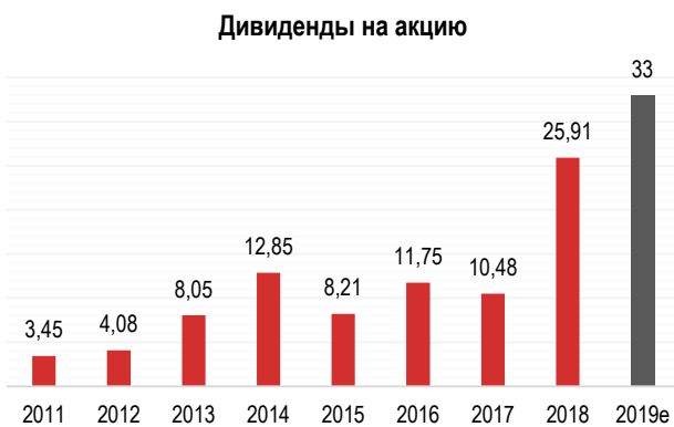
Рис. 1. Дивиденды «Роснефти»